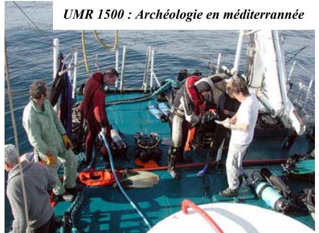
UMR 1500 : Archéologie en méditerranée